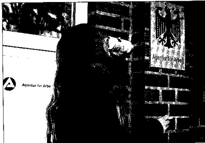
Als Perspektive bleibt vielen Hauptschülern nur das Pils vor dem Arbeitsamt

Auch in den Landkreisen Harburg und Stade ist die Krise dieser Schulform unüberschaubar. In Buchholz könnte es zum Bei-